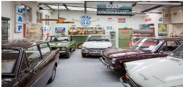
De DAF ruimte