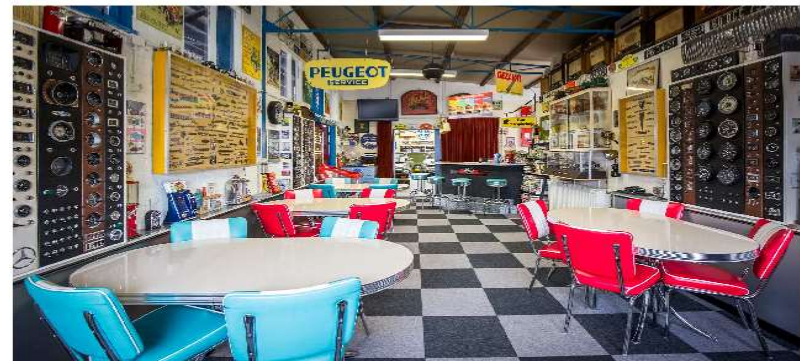
De kantine, ingericht in de jaren 50 stijl