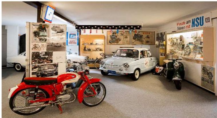
De nieuwe NSU ruimte, ingericht in 2013