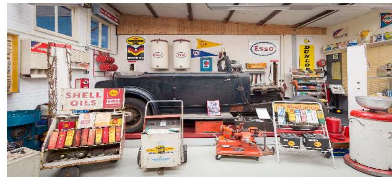
De werkruimte met gereedschappen, oliebliken e.d.